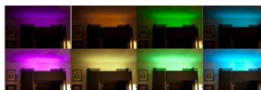
Ruban Pastel R5050RGBW48-IP65