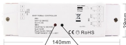
Témoin de fonctionnement